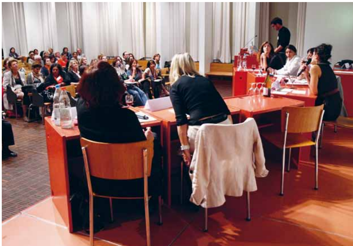
Gutbesetzte Aula der Universität Basel