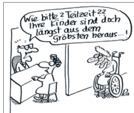
Cartoon: Renate Alt

Weitere Informationen auf S. 8 und unter: www.familienfreundliches-basel.ch