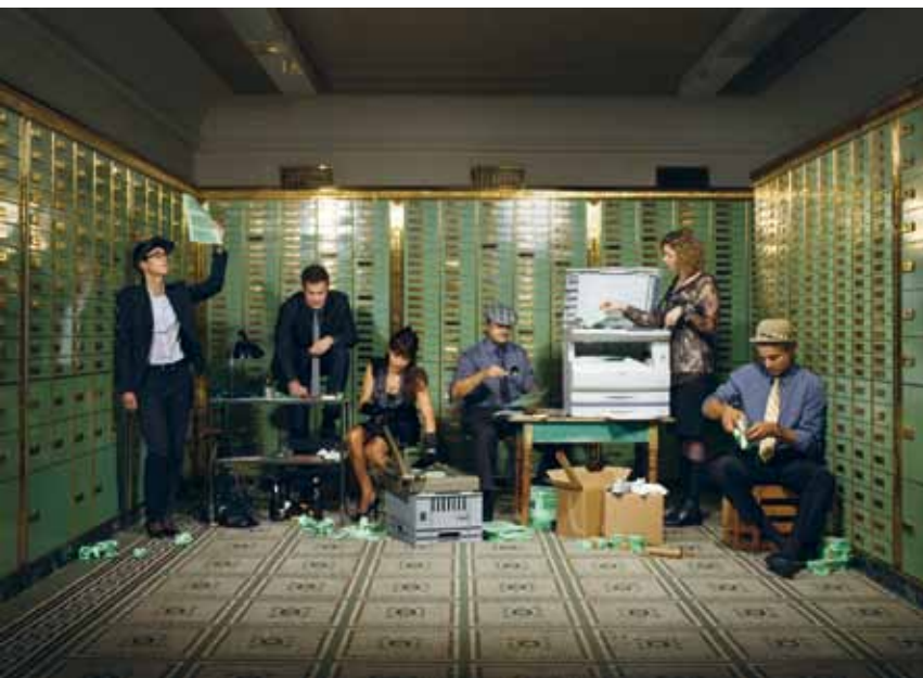
Das Foto ist ein Geschenk der Regierungen beider Basel an die Bank Coop

Die Bank Coop erhält den mit 20 000 Franken dotierten Chancengleichheitspreis 2011 für ihr «Massnahmenpaket Gleichstellung und Familienfreundlichkeit». Damit zeichnen die Regierungen beider Basel ein Unternehmen aus, das die Gleichstellung umfassend integriert.