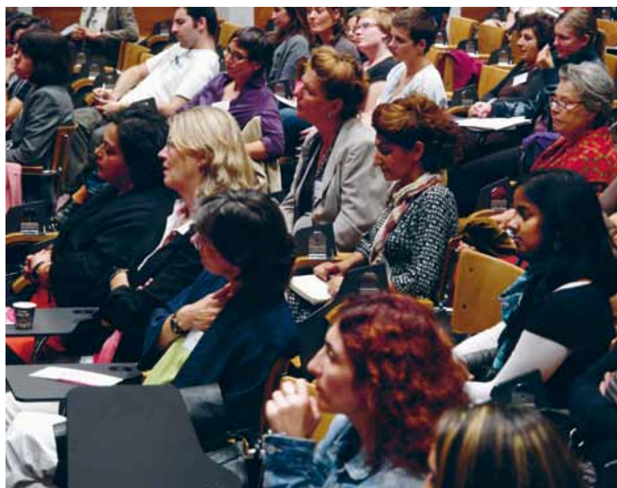
Das Podium bot viel Stoff zum Nachdenken